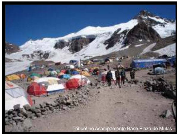
Triboo! no Acampamento Base Plaza de Mulas

Local de Saída: Aeroporto Internacional de Guarulhos - Guarulhos / São Paulo